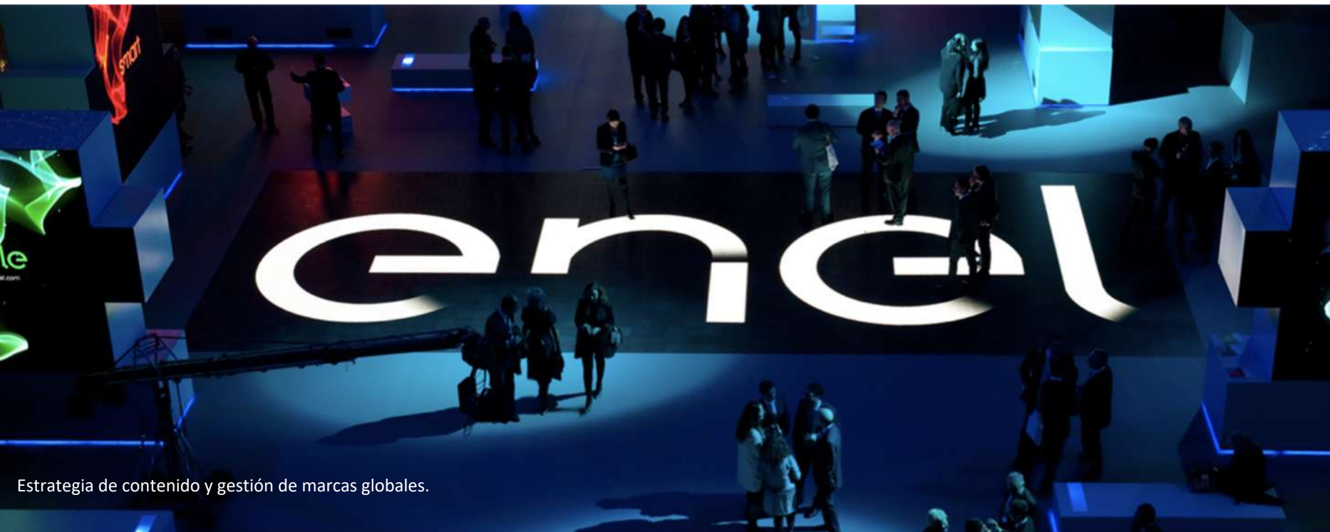
Estrategia de contenido y gestión de marcas globales.