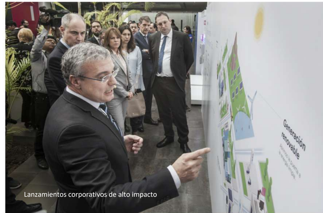
Lanzamientos corporativos de alto impacto