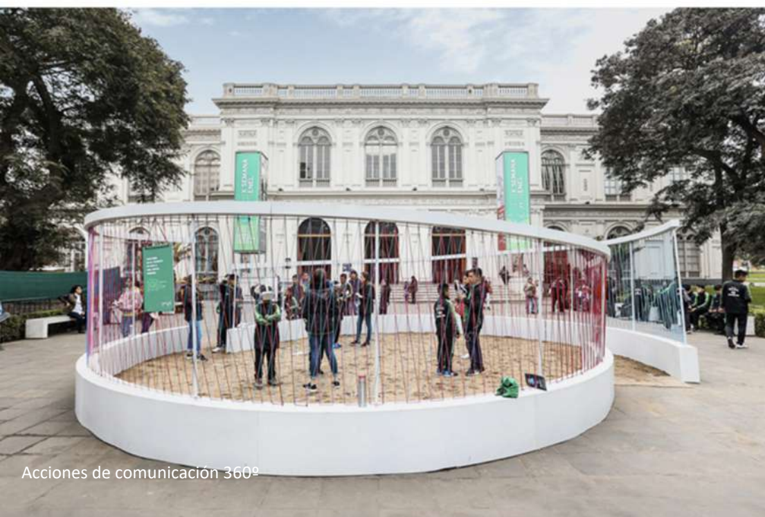
Acciones de comunicación 360°