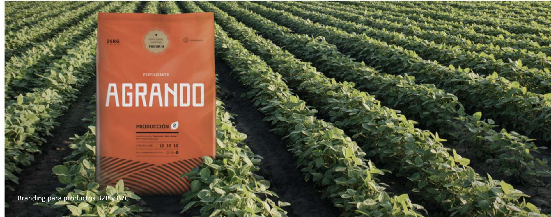
Branding para productos B2B y B2C