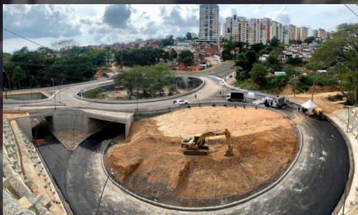
Construcción del Intercambiador Fátima Ubicado en el Sector de la Intersección de la Transversal Oriental con la Vía Alto viento - Municipio de Floridablanca. Valor :42.019 SMMLV