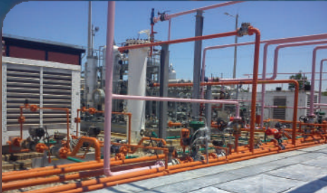
Construcción de tubería para el campo de gas de Sardinata. Valor: 16.286 SMMLV