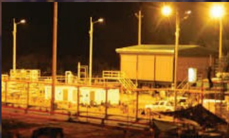
Obras de construcción del patio de lavado de intercambiadores en la GRB. Valor 18350 SMMLV