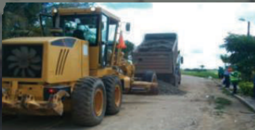
Construcción de 2,7 km de la Vía Surimena dentro del Contrato de Facilidades de Superficie VEX