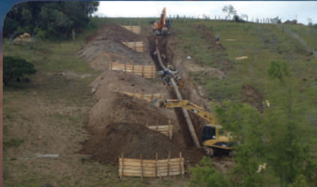
Mantenimiento de Gasoductos de los Diferentes Distritos del TGI