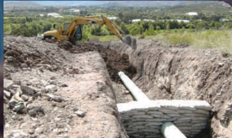
Obras de Construcción de Gasoducto Gibraltar – Bucaramanga en Tubería de 12" Valor:7.427 SMMLV