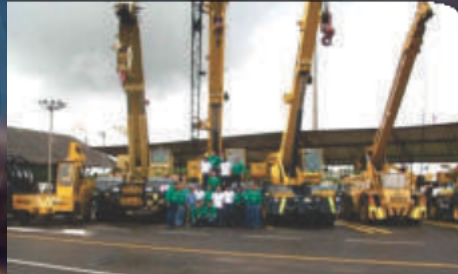
Servicio de Mantenimiento Preventivo y Correctivo de los Equipos Pesados y Diesel de la Refinería de Barrancabermeja y Cartagena. Valor 12.407 SMMLV