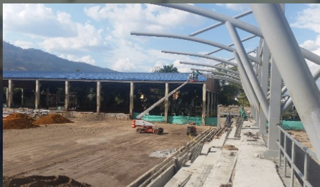
Mejoramiento y ampliación estadio primero de mayo del municipio san juan de Girón, Santander, centro oriente. Valor:9.055 SMMLV