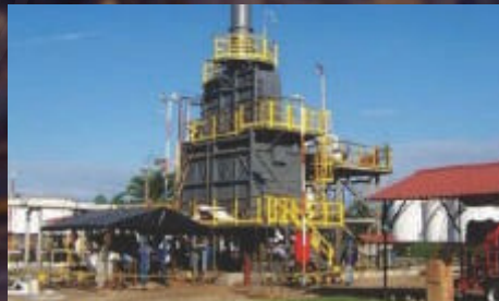
Servicio de Mantenimiento del Horno y Equipos Asociados en la Planta de Orito – Ecopetrol. Valor: 1.8167 SMMLV