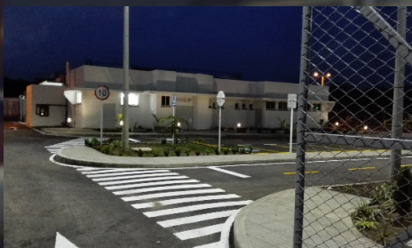
Construcción Laboratorio Base Rondón En La Guajira. Valor: 10.094 SMMLV