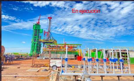
Contrato Marco Construcción de obras civiles, eléctricas, mecánicas e instrumentación requeridas por la Vicepresidencia de proyectos y perforación para Ecopetrol SA y para su grupo empresarial. Valor: 73.582,60 SMMLV