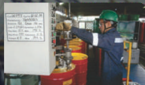
Operación del Sistema de Llenado de Tanques