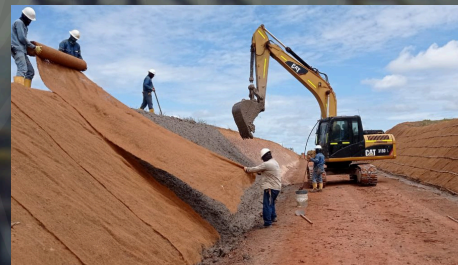
Construcción de 4,2 km de facilidades del paquete 2 de locaciones para el proyecto Caño Sur Este Modulo 3 perteneciente al HUB Sur Oriente de Ecopetrol S.A