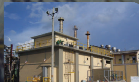
Obras para la Construcción de la Nueva Subestación de 630 KVA de la unidad de Servicios Industriales de la Refinería de Cartagena.. VALOR : 6.177 SMMLV