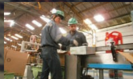
Operación Sistema de Empaque