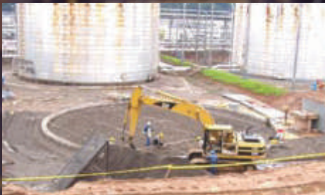
Mantenimiento de Tanques de la Gerencia Poliductos en Sebastopol – Ecopetrol. Valor: 2.087 SMMLV