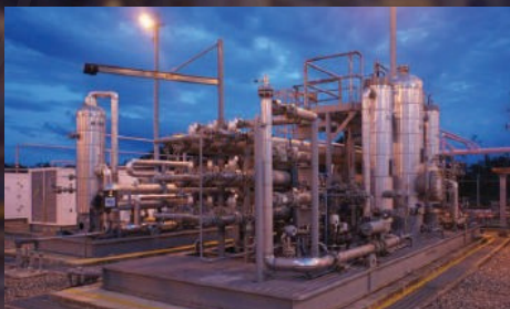
Construcción de la planta de compresión de gas de Sardinata de 5 Mpcd de capacidad. Valor: 16.286 SMMLV