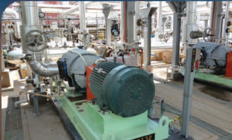
EPC- Construcción de los sistemas de mezcla, tubería, bombeo y almacenamiento de asfalto. Valor: 14.039 SMMLV