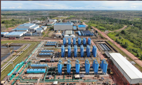
Contrato Marco Construcción de obras civiles, eléctricas, mecánicas e instrumentación requeridas por Ecopetrol SA y su grupo empresarial. Valor: 190.540 SMMLV