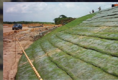
Obras de geotecnia para la construcción de vías en la estación de compresión de gas para TGI.