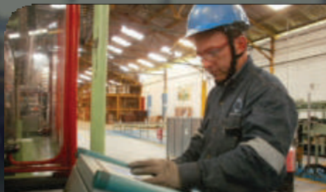
Operación de Equipos para Envases