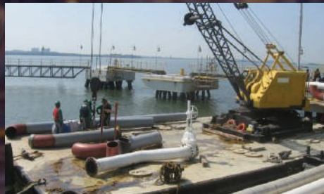
Obras Metalmecánicas para las Líneas de Proceso, Tanques de Almacenamiento en el Área de TNP de la Refinería de Cartagena. Valor:3320 SMMLV