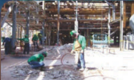
Obras de Mantenimiento Técnico de Tipo Civil y Metalmecánico en las Plantas de la Refinería de Cartagena. Valor : 8.989 SMMLV