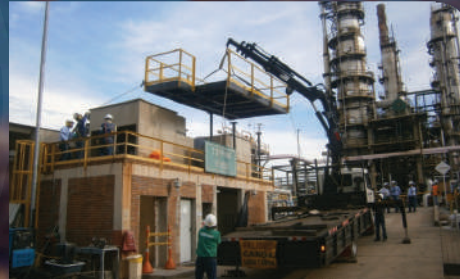
Presurización de los cuartos de control de la GRB. Valor: 14.510 SMMLV