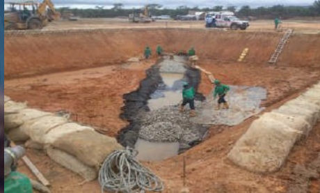
Contratos Marco para el Montaje y Construcción de Facilidades de Superficie para Proyectos de Producción y Exploración a Nivel Nacional de la Gerencia VEX y GCO de Ecopetrol. Valor : 138.669 SMMLV