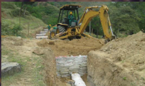
Cambio de Recubrimiento y Mantenimiento de los Gasoductos Pertenecientes a TGI S.A E.S.P. Valor:27.447 SMMLV