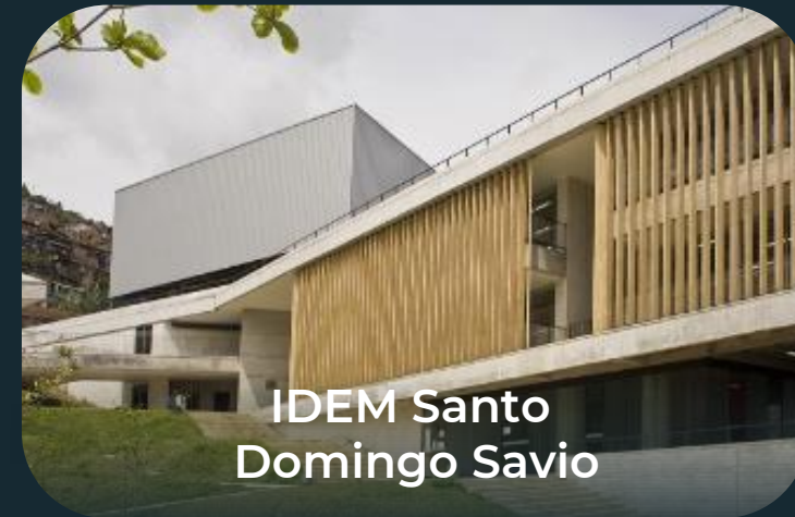
IDEM Santo Domingo Savio