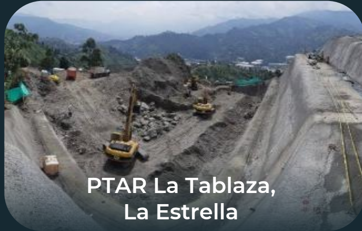
PTAR La Tablaza, La Estrella