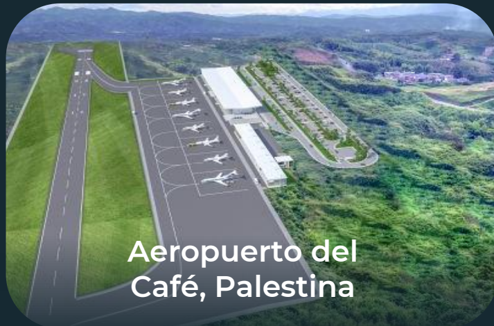
Aeropuerto del Café, Palestina