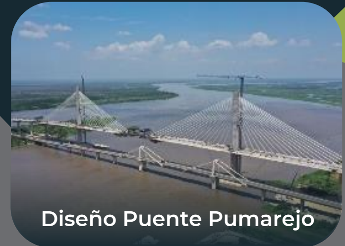
Diseño Puente Pumarejo