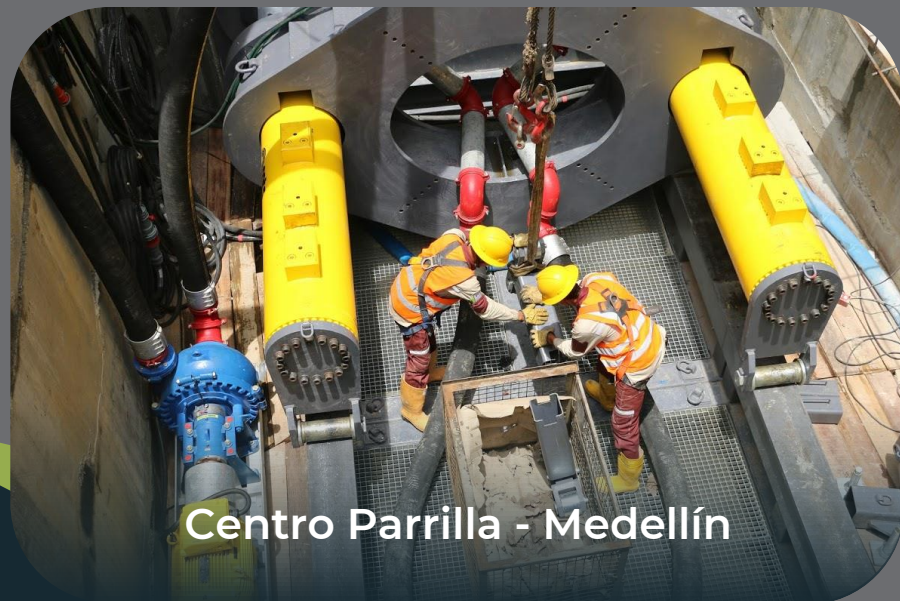
Centro Parrilla - Medellín