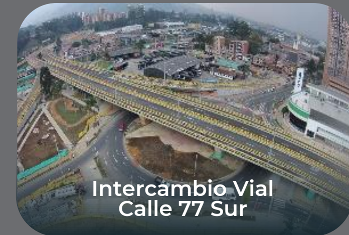
Intercambio Vial Calle 77 Sur