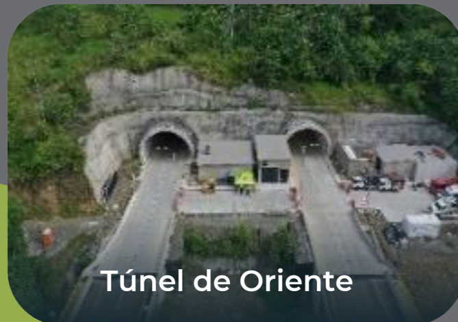
Túnel de Oriente