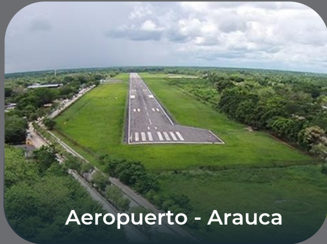
Aeropuerto - Arauca