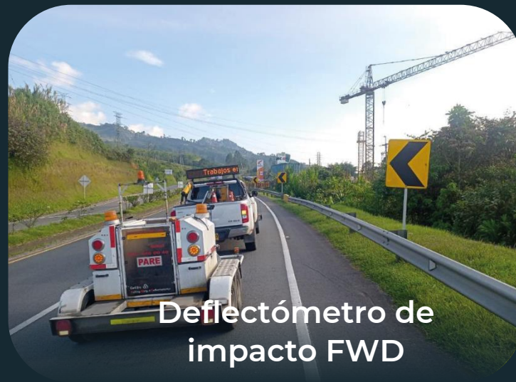
Deflectómetro de impacto FWD