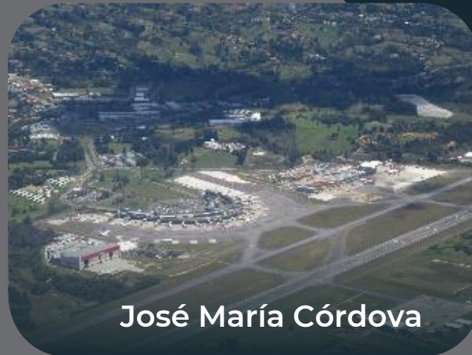
José María Córdova