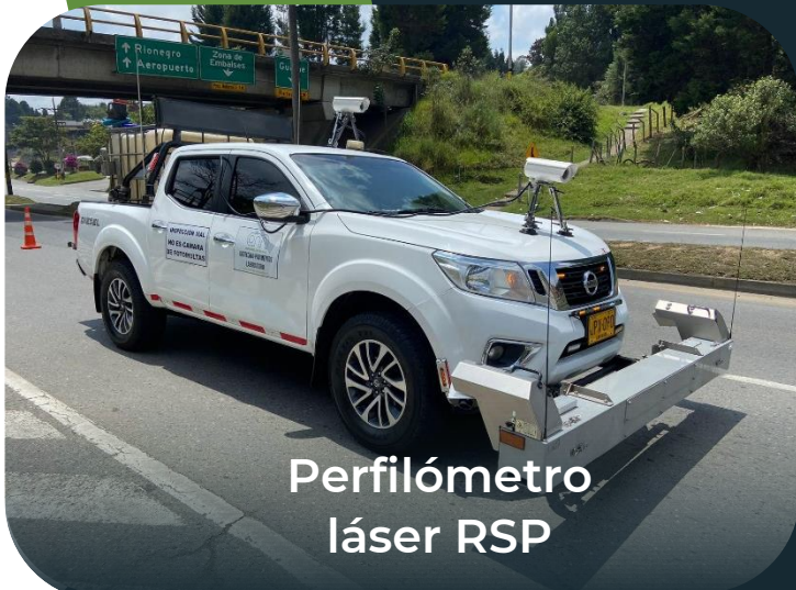
Perfilómetro láser RSP