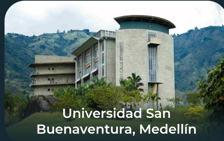
Universidad San Buenaventura, Medellín