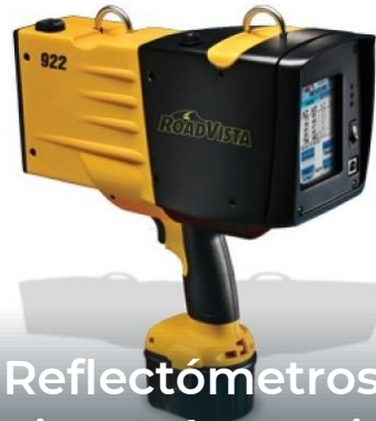
Reflectómetros horizontal y vertical