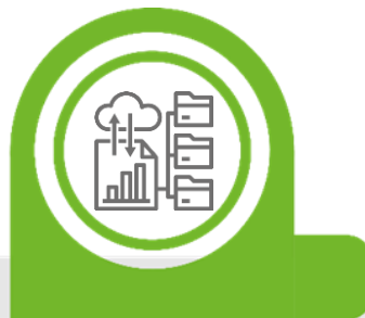
Almacenamiento de datos