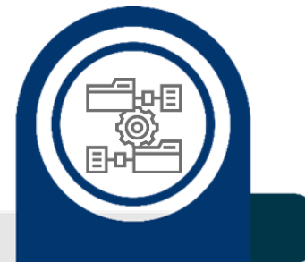
Gestión de datos