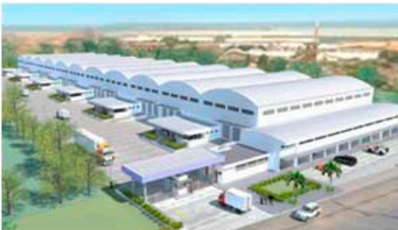
PARQUE INDUSTRIAL GALAPARK REDES CONTRA INCENDIOS-REDES DE ACUEDUCTO