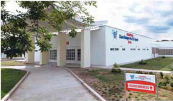
HOSPITAL SAN ROQUE - EL COPEY (CESAR) REDES CONTRA INCENDIO - GASES MEDICINALES