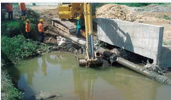
BOXCULVERT VEHICULAR - MALAMBO (ATL) ESTRUCTURA EN CONCRETO