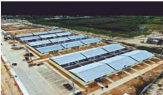
URBANIZACIÓN VILLA CAROLINA (PALMAR DE VARELA) REDES DE ACUEDUCTO - ALCANTARILLADO