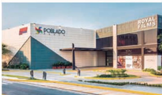
C.C. POBLADO - STO. TOMAS (ATL) REDES PLUVIALES

Soluciones con calidad, seriedad y cumplimiento.