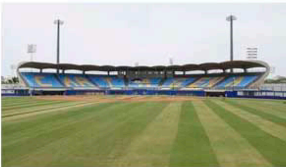
ESTADIO DE BEISBOL 11 DE NOVIEMBRE - CARTAGENA RED CONTRA INCENDIO - REDES PLUVIALES