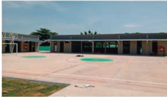
COLEGIO POLICARPA SALAVARRIETA - PLATO (MAGD) REDES CONTRAINCENDIO