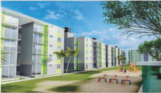
URBANIZACIÓN LAS CAMELIAS - MALAMBO (ATL) REDES HIDROSANITARIAS - CONTRAINCENDIO