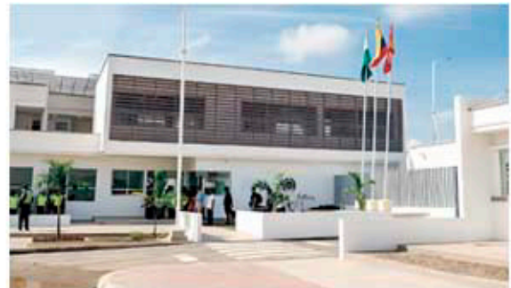
ESTACIÓN DE POLICIA - EL POZÓN (CARTAGENA) REDES HIDROSANITARIAS INTERNAS Y EXTERNAS

Soluciones con calidad, seriedad y cumplimiento.