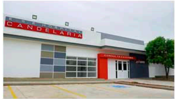
HOSPITAL ESE CANDELARIA REDES HIDROSANITARIAS-RCI-GASES MEDICINALES