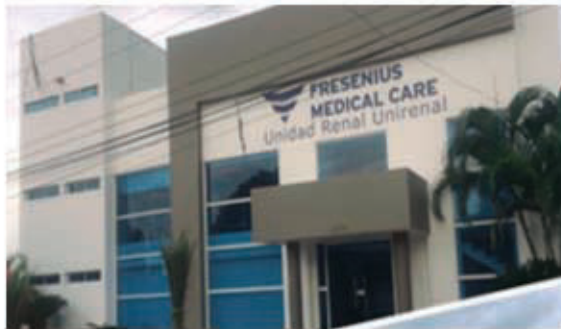
FRESENIUS CENTER - BARRANQUILLA REDES HIDROSANITARIOS